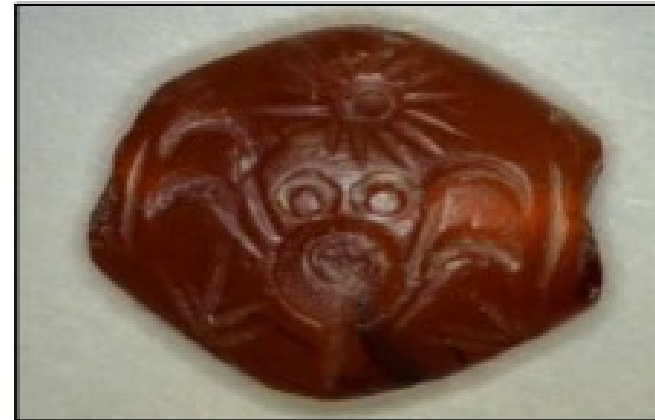
Figure 3.8 – Seal stones made of carnelian, left - CMS II, 4, 153, right – CMS II, 3, 367.