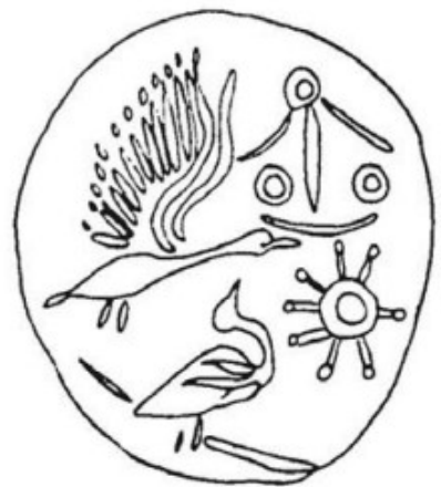
FIG. 137 -- IV 257: 2 waterbirds

HM no. unknown (L) (Xanthoudides 1907: pl. 8.104) 2 Suns ab & 1 Sun bel